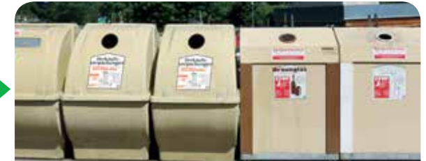
Eine ZAK-Wertstoffinsel ist auch in Ihrer Nähe: Ein Standort pro 550 Einwohner

Ab 1. Januar 2018 werden alle drei Fraktionen in EINEM Container gesammelt.